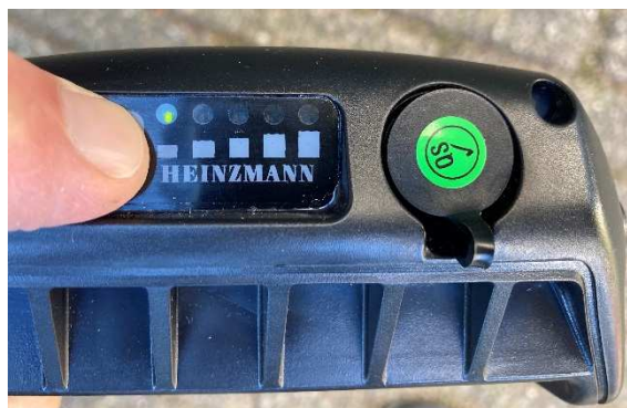
accu bijna leeg